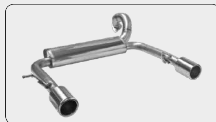
Twin Ø 90 mm

Ersatzrohr für Vorschalldämpfer (Nutzung im öffentlichen Straßenverkehr nicht zulässig)