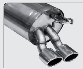
Oval 105x75 mm