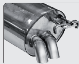
Double Ø 54 mm