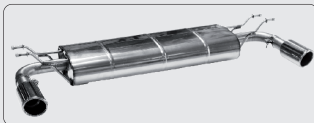
Twin E Ø 90 mm, 20°