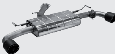
Twin RACE S Carbon Ø 110 mm