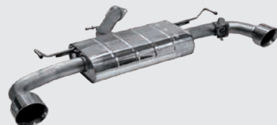
Twin RACE S Ø 110 mm