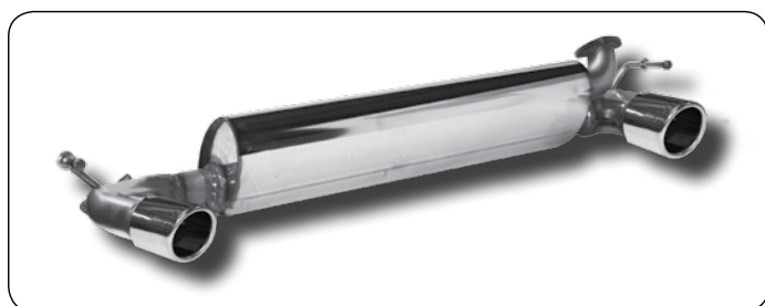
Twin E Ø 76 mm RETW3-T76E