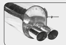
Double S Ø 76 mm

Endschalldämpfer plus Adapter (als Ersatz für den Serienschalldämpfer)